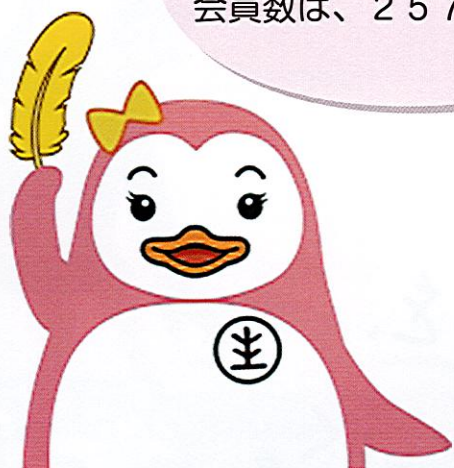
更生ペンギンの サラちゃん

更生保護に関する事業の充実発展に寄与するため、更生保護団体や更生保護施設への助成、研修事業などを行っています。 会員数は、257名です。